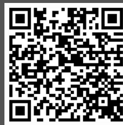
QR code de Smart Parrainage